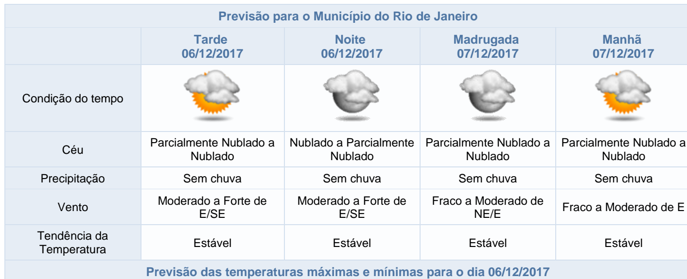
Previsão para o Município do Rio de Janeiro

Segundo o AlertaRio, um sistema de alta pressão influenciará o tempo no dia de hoje na cidade do Rio. Assim, essa quarta-feira será de nebulosidade variada, ventos moderados a fortes no período da tarde/noite e temperaturas estáveis, sendo a máxima prevista de 31°C. Há pequena possibilidade de chuviscos isolados.