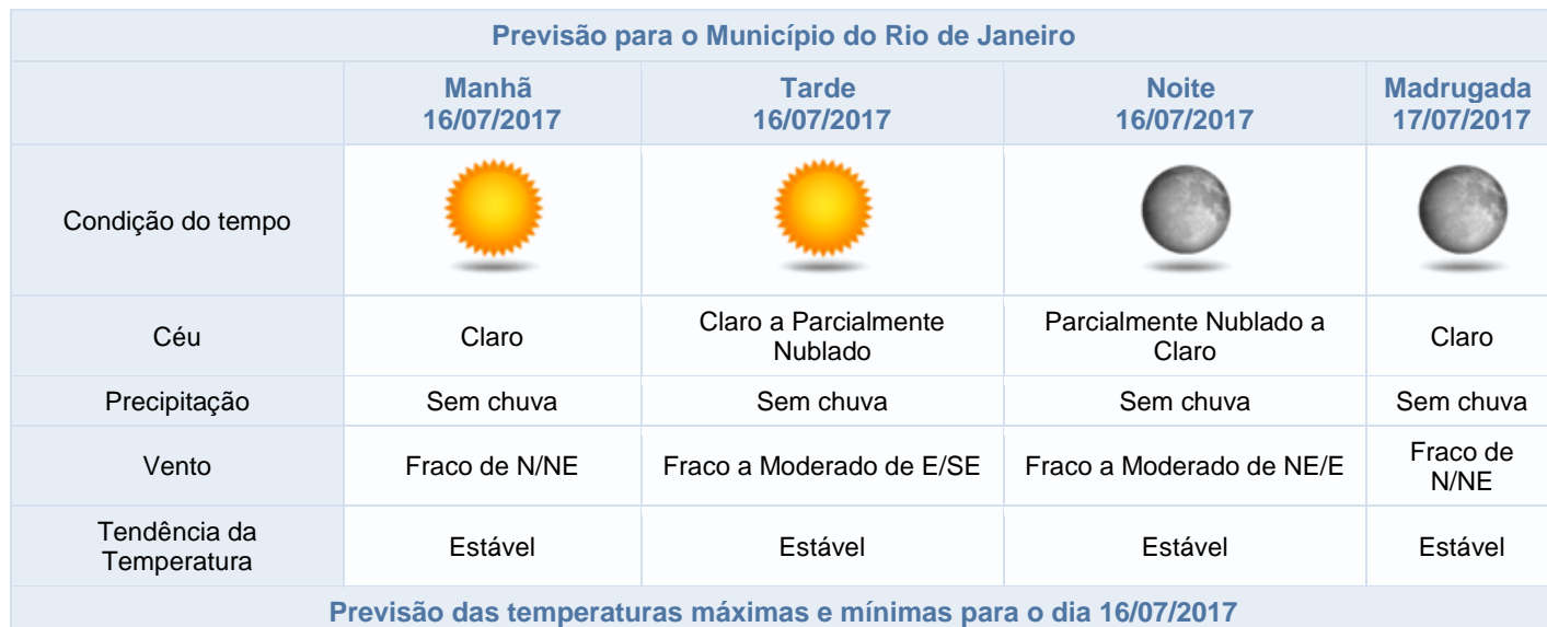
Previsão para o Município do Rio de Janeiro

Previsão das temperaturas máximas e mínimas para o dia 16/07/2017